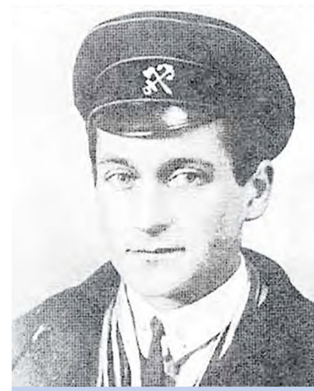
Вадим Борисович Шавров (1898–1976), советский авиаконструктор, кандидат технических наук, историк авиации

Им написаны книги «История конструкций самолетов СССР до 1938 года» и «История конструкций самолетов в СССР, 1938–1950». Фактически он создал отечественную шко-