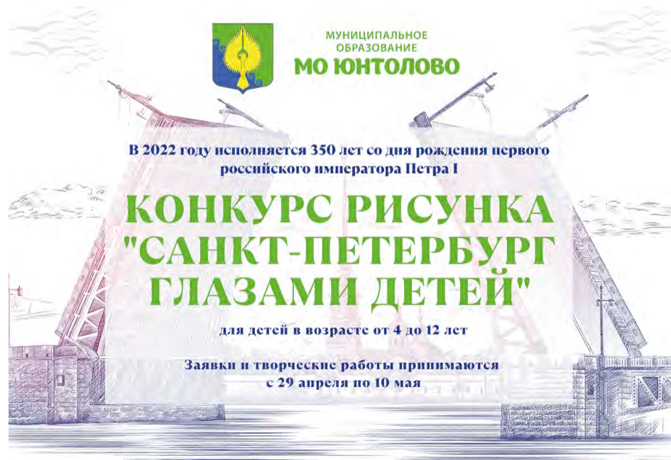
Рисунок может быть выполнен в любой технике рисования (масло, акварель, тушь, гуашь, цветные карандаши и т. п.). Представленные на Конкурс работы должны быть не меньше формата А4 (210x290 мм) и не более А3 (420x297 мм). Оригинал рисунка необходимо будет предоставить в МА МО Юнтолово в указанное в ответном сообщении время.

Желаем всем творческого вдохновения и удачи!