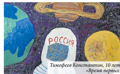
Тимофеев Константин, 10 лет, «Время первых»