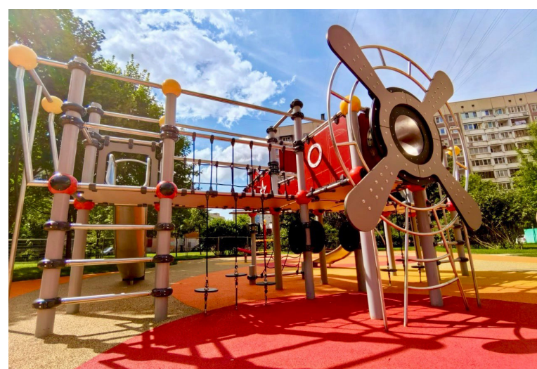
Комендантский пр., 40