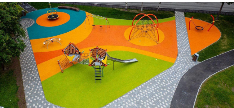
Комендантский пр., 36

скольку на всей территории МО Юнтолово отсутствуют специально предназначенные площадки для выгула домашних животных.