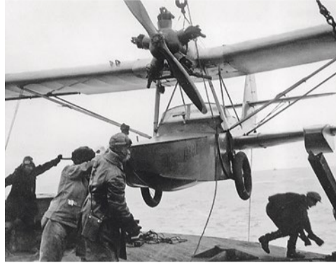
Ш-2 опускают бортовым краном с палубы на воду