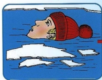
Не погружаться в воду с головой