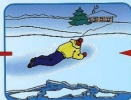
Проползти 3-4 метра по своим следам