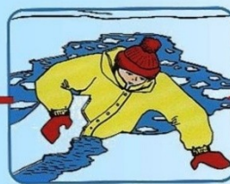
Забросить на лед ногу, откатиться от полыни