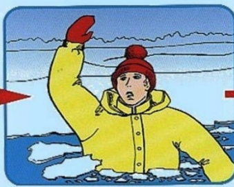
Не паниковать, позвать на помощь