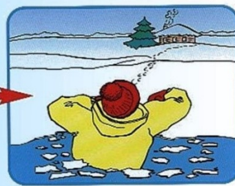
Выбираться в сторону, с которой произошло падение