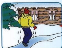
Не отдыхая, бежать к близкому жилью