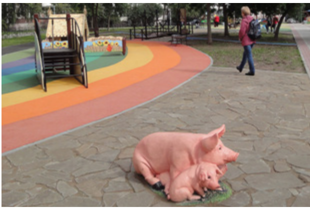
пр. Авиаконструкторов, д. 14, к. 3.