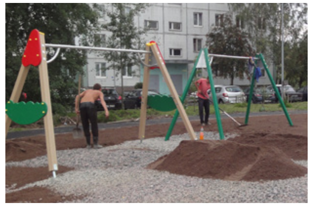
ул. Планерная, д. 41, к. 2