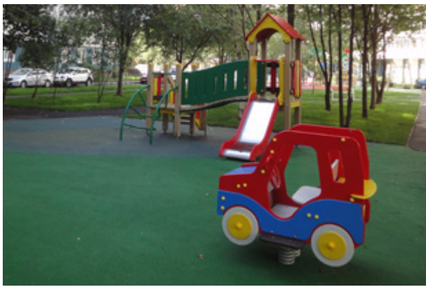
ул. Мартыновская, д. 10