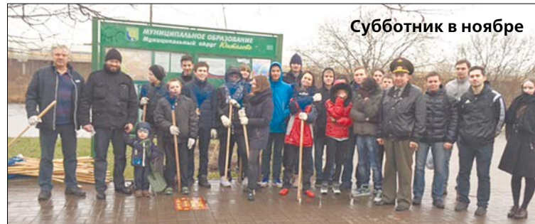
Субботник в ноябре

Так, 14 ноября на территории МО Юнтолово члены Всероссий-